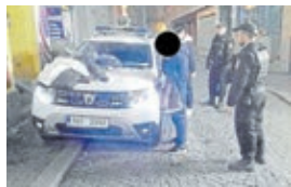
Z deníku městské policie