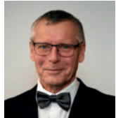
Petr Nedvědický primátor Ústí nad Labem